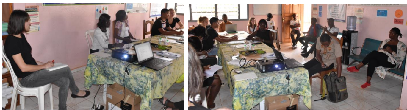
Les mesures de distanciation interpersonnelle ont été respectées lors des travaux de réflexion en vue de l'évaluation stratégique de la situation de crise et de l'urgence imposées par Coronavirus. Elles permettent de minimiser les risques de contamination en réduisant les contacts entre les sujets sensibles et les personnes infectées.

Entre sensibilisation via les réseaux sociaux et appels des membres des groupes et communautés cibles, les équipes opérationnelles travaillent dans cette situation d'urgence à relayer les mesures préventives et dispositions édictées par l'Organisation Mondiale de la Santé (OMS) et le Gouvernement de la République du Cameroun afin de limiter les effets catastrophiques qu'une contamination généralisée des populations est susceptible d'occasionner. Dans cet esprit, une réflexion a été organisée pour prévenir les risques de contamination à la Corona Virus et contribuer à la limitation de l'expansion de cette pandémie.